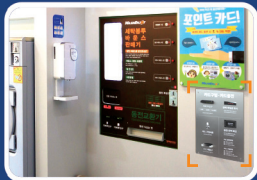
카드충전 판매기를 적용한 예입니다.